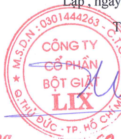
Cao Thành Tín